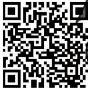
安庆职业技术学院秦潭学子官微

群星无光，今夜微凉。 我爱慕的姑娘，想必已进入梦乡。 那嘴角的微笑，是否仍让我牵肠。 我要把喜悦捏成幸福的形状。 这样即使在沁凉的秋夜。 也可以感知到你就在身旁。 (文/秦潭学子 王凡)